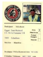
Photo du participant

Chacun ajoute une photo et complète l'adresse et complète son carnet.