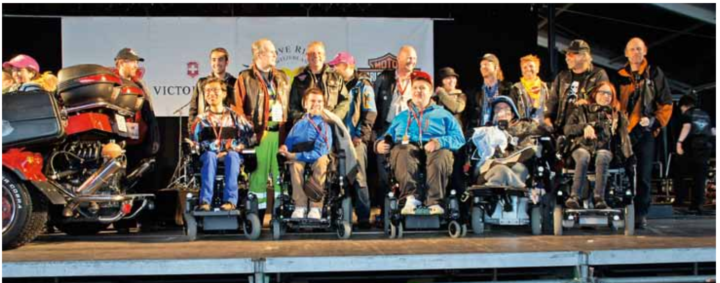
Love Ride Egels mit OK / Love Ride Egel avec CO

nationale et internationale rassemblant plus de 10'000 motards et 17'000 spectateurs. D'autre part, une performance réjouissante doit être mentionnée: la vente d'articles et les dons ont contribué à la récolte de Fr. 520'000 pour le soutien de la bonne cause. La campagne FMS-bpa «Stayin-Alive» convient très bien à la Love-Ride. Nous remercions chaleureusement la commission de la sécurité routière pour l'engagement fourni. ◆