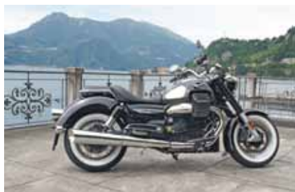
Eldorado in black bei Mandello del Lario

Chrom und eine breite tiefe Sitzbank 724mm Sitzhöhe, dazu der weit geschwungene verchromte Stahllenker, lassen die Eldorado über weite Strecken, Fahrer und Sozia relaxt Cruisen. Trotz Retro-Look sind die neuen mit modernster Elektronik ausgestattet. Drive-by-Wire (elektronische Gasgriffsteuerung) Tempomat, Traktionskontrolle, sowie ein abschaltbares ABS Bremssystem sind Serienausstattung. Ein reichhaltig und perfekt gestyltes Accessoires Angebot, gibt jedem MOTO GUZZI Driver die Möglichkeit Sein persönliches Bike zu bauen. Der Piaggio Konzern hat entschieden in MOTO GUZZI wird viel investiert, neue Modelle kommen auf den Markt, das gibt dem Händler und den Kunden Sicherheit. ◆