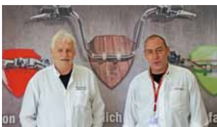
FMS Sicherheitskommission Commission sécurité routière FMS