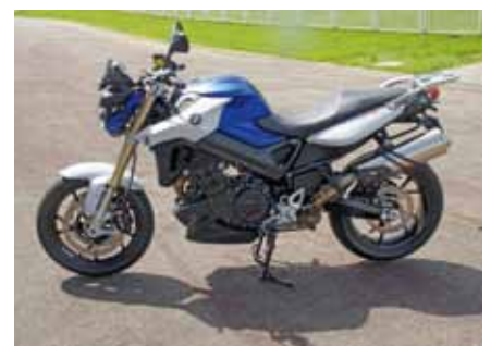
F800R ABS in Racingblue metallic matt