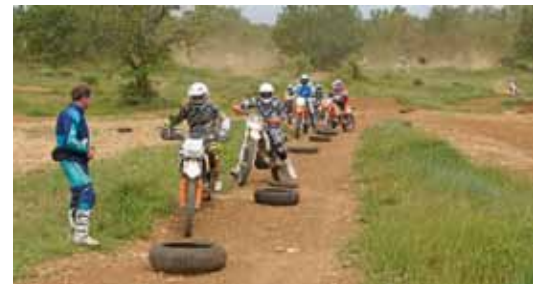
Übung macht den Meister

Un professionnel montre comment s'y prendre