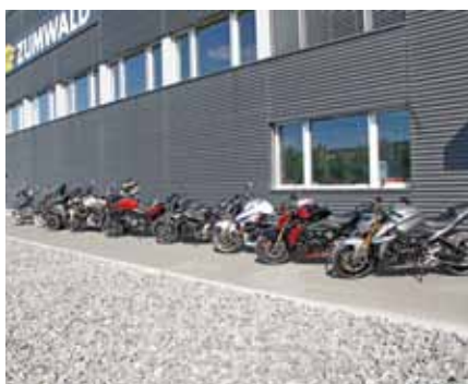
Suzuki Domicil Avenches