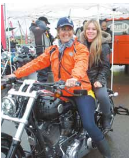
Regen macht schön / La pluie rend beau