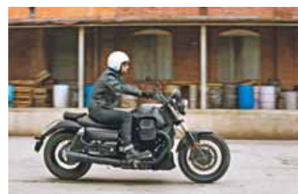
Audace in USA