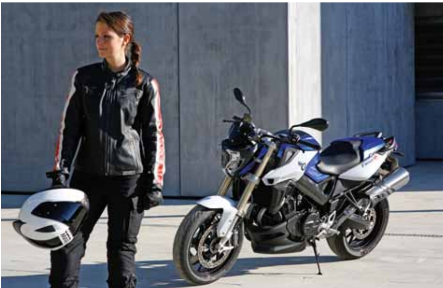
Ideales Lady Beginnerbike

Und das alles zu einem sensationellen Grundpreis Fr. 10'550.-, Euro Advantage Prämie Fr. 1'100.-, Netto Kundenpreis Fr. 9'450.- und Freude herrscht. ♦