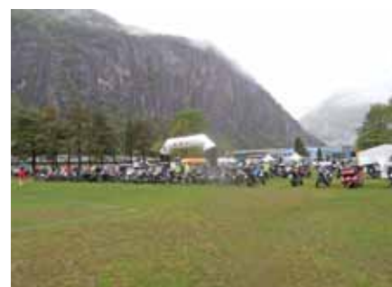
Aperitivo motociclista Timoto

Walter Wobmann | Questa manifestazione molto bella e variegata ha avuto luogo quest'anno per la 19° volta. È la prima volta che il FMS-Turismo vi partecipa. Il mattino iniziava con un buon caffè poi siamo partiti per il giro in moto ben organizzato con successivo aperitivo analcolico preparato con prodotti locali. L'aperitivo si è tenuto a Riazzino a causa del maltempo. Verso mezzogiorno abbiamo continuato in direzione valle Maggia, dove i cuochi ci hanno sorpresi con la polenta con le luganighe. Un complesso Rock ha suonato dal vivo tutto il giorno. Speriamo che la 20° edizione potrà svolgersi sotto un sole splendente. Un cordiale ringraziamento al Moto-Club Condor per la calorosa accoglienza e la riuscita organizzazione. ◆