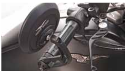
Audace 2015 mit schönem Accessoires Audace 2015 avec de beaux accessoires