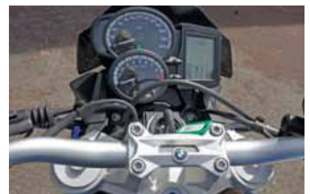
Cockpit alles was man braucht Tout ce qu'on a besoin