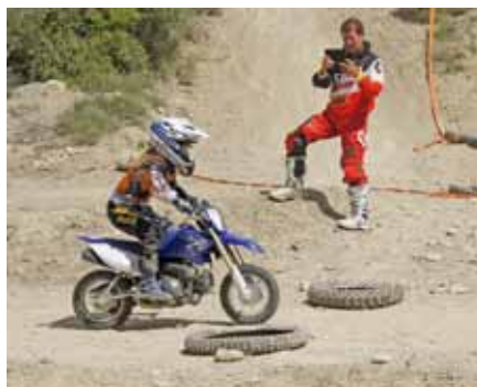
Video-Analyse für die Kleinsten Une analyse video pour les plus jeunes