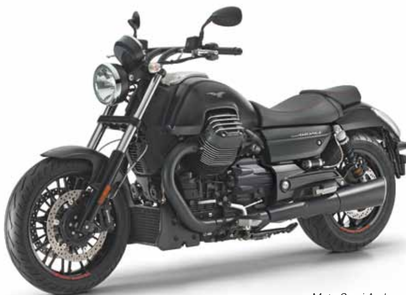
Moto Guzzi Audace 2015