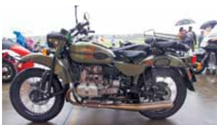
Russian Powerbike 40PS

VILLA D' EPOCA Alexandra Plancherel Ai Ronchini 6677 Aurigeno +41 91 756 50 00 info@villadepoca.ch