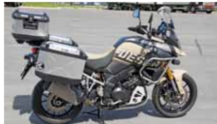
V-Strom Desert Fr. 15'999.–