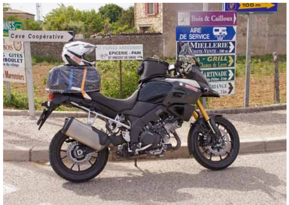
V-Strom auf grosser Tour