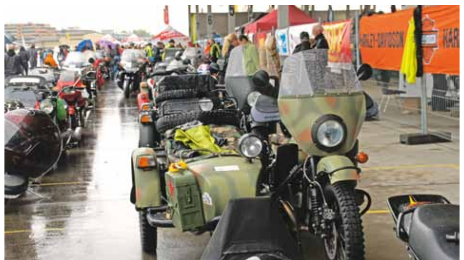
Gespanne bereit zum Love Ride / Sidecars prêts pour la Love Ride