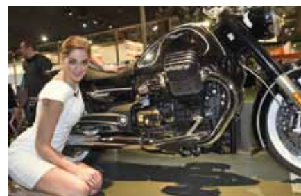
Eldorado belle Italia