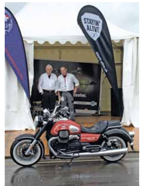
FMS-bfu an der Love Ride