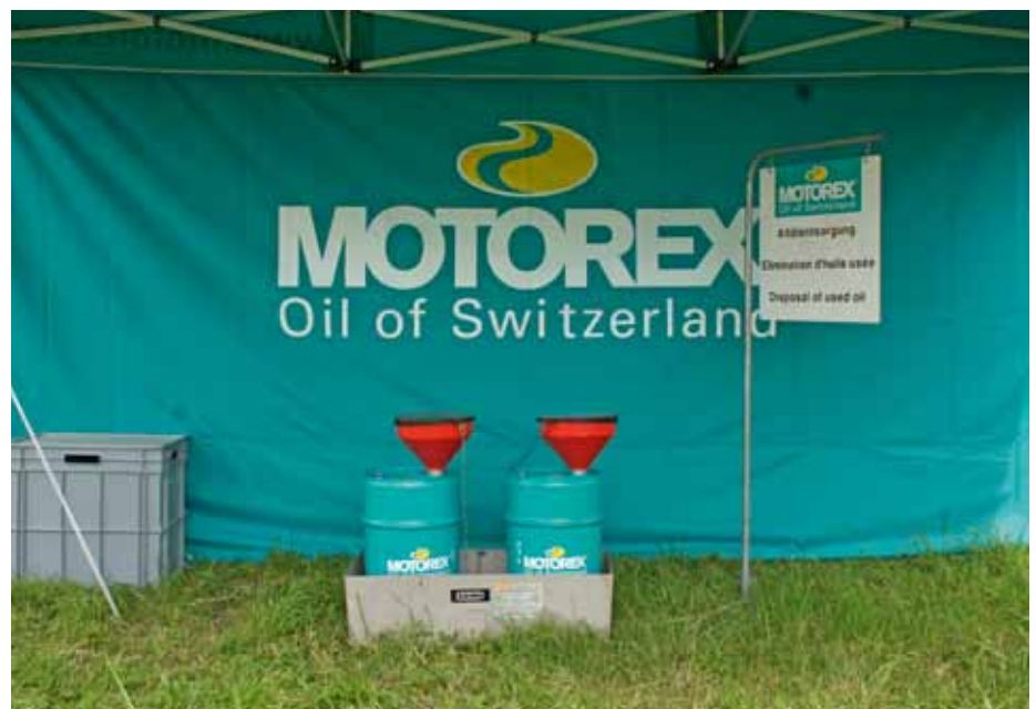
Ecologie MX Schweiz