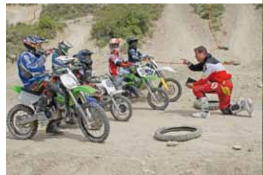
Du machst es gut... C'est très bien...