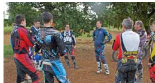
Theorie auf was es ankommt La théorie avant la pratique