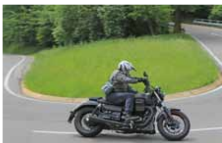
Audace beim Test