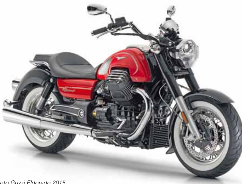
Moto Guzzi Eldorado 2015