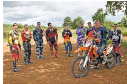
Ein Profi zeigt wie es geht

Infos: www.offroad-training.ch ou dany.wirz@offroad-training.ch Téléphone 079 230 71 25