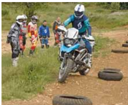
Geht auch mit BMW R1200GS C'est aussi possible avec une BMW R1200GS