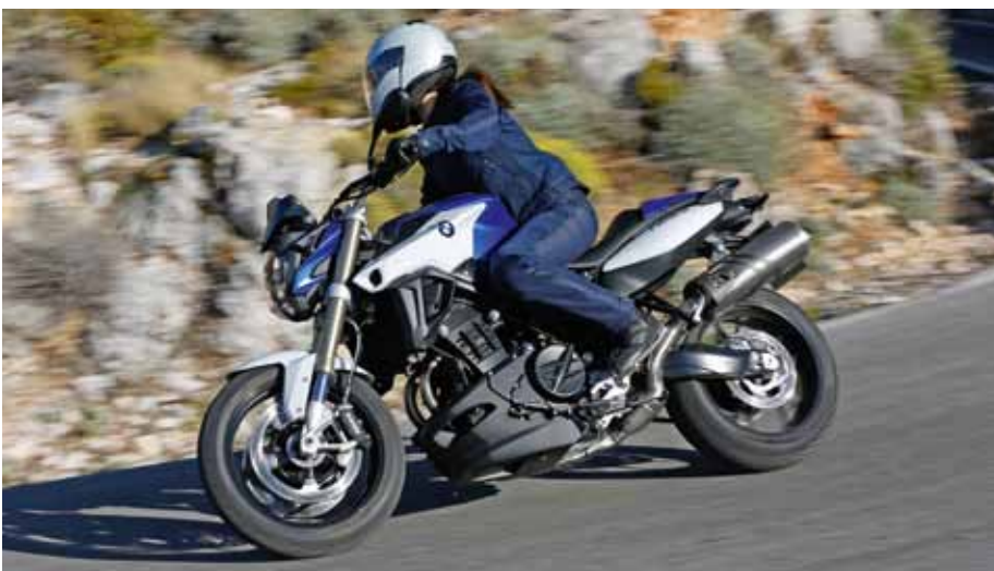
Easy to Drive