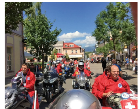
Schweizer Teilnehmer / Participants suisses

clubs geehrt wurden. FMVs gewinnt vor MC Les Bayards und MSC Züri/Zürich. Am letzten Tag fand die Parade der Nationen statt, welche den offiziellen Abschluss der Veranstaltung bildete. Viele Zuschauer haben die 25 Nationen mit Applaus verabschiedet. Anschliessend folgte das traditionelle Essen mit Preisverleihung. Italien gewann die FIM Challenge. Die Teilnehmer haben eine gute Rallye erlebt und freundliche Momente im multikulturellen Ambiente genossen. Bravo an die Slowakei für die ausgezeichnete Organisation! Nächstes Jahr wird Sundswall in Schweden der Gastgeber sein. ◆