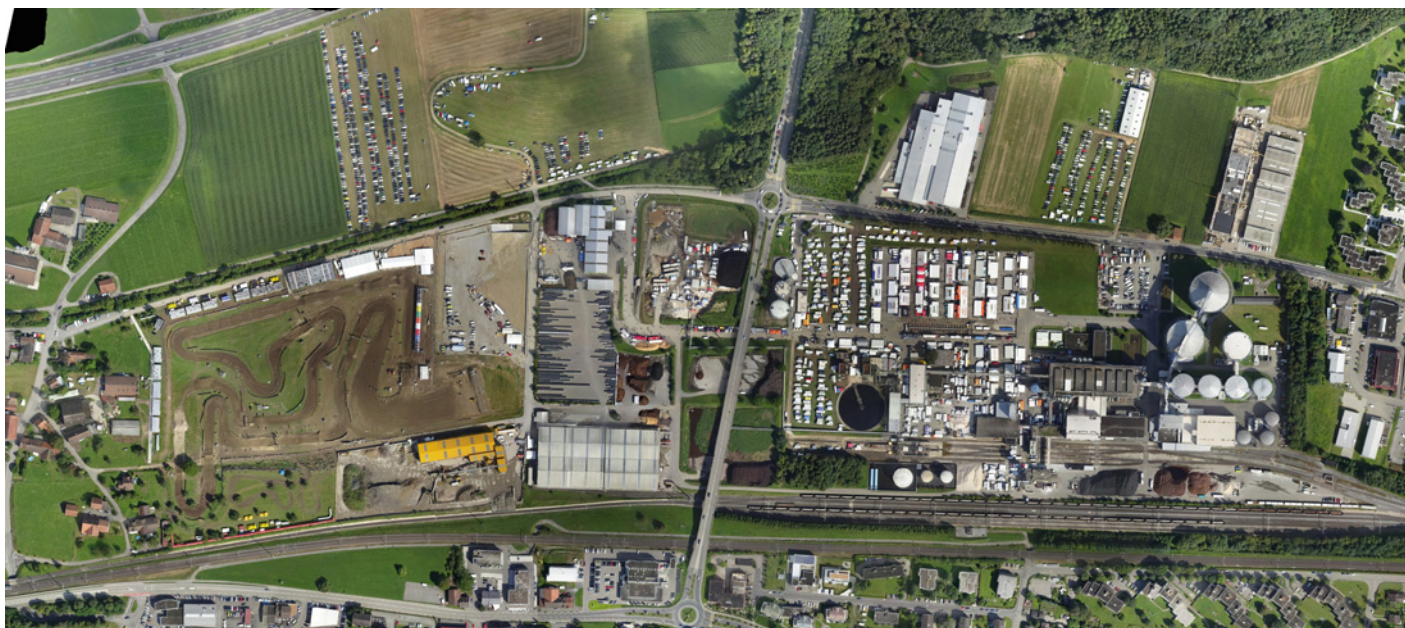
MXGP-Swiss-Anlage, Schweizer Zucker / Vue aérienne MXGP, Sucre Suisse

Walter Wobmann, Conseiller national, Président central de la FMS ◆