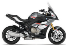
S 1000 XR ABS