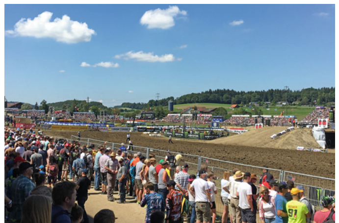
MXGP OF SWITZERLAND