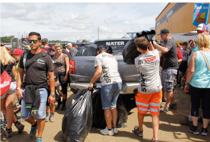
MXGP Team Entsorgung / Equipe de déblaiement MXGP