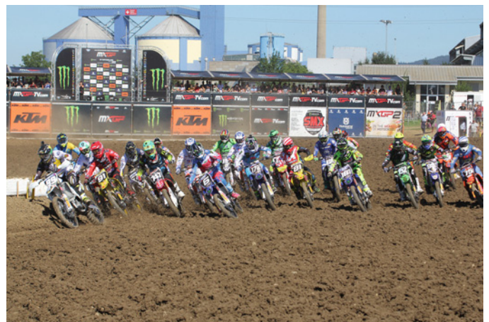
Start MX2 Lauf 2 / Départ 2 ème manche MX2