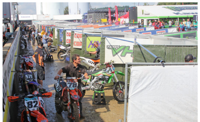
Bike Wash MXGP