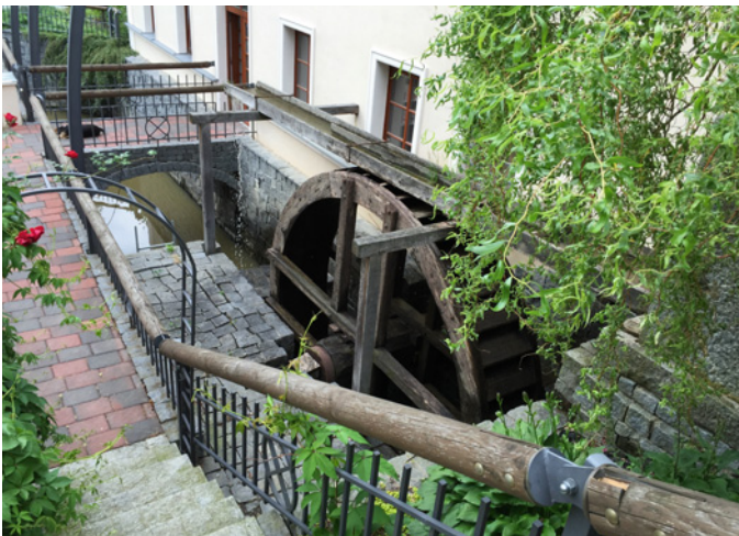
Mühle / Moulin