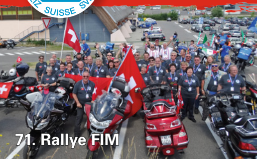
71. Rallye FIM