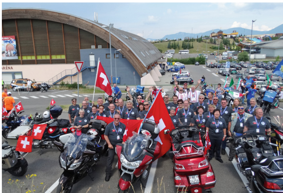
Schweizer Nationalmannschaft / Equipe de Suisse

marche, pour finir la journée tout le monde s'est retrouvé pour le repas du soir au camp. La remise des prix pour les classements interclubs a permis à la FMVs de remporter le prix du meilleur club suisse classé devant le MC Les Bayards et le MSC Züri/Zürich. Le dernier jour, les motards ont bichonné puis décoré leur monture à souhait car la parade des nations est le point final d'une manifestation colorée et animée, un nombreux public a applaudi le passage des 25 nations. La cérémonie de clôture s'est déroulée avec le traditionnel repas et la remise des prix. C'est l'Italie qui remporte le challenge FIM. Les participants ont vécu un bon Rallye avec des repas à la hauteur d'une telle manifestation, chacun a pu partager un moment amical et multiculturel dans une ambiance agréable. L'an prochain, nous irons en Suède à Sundswall. Il est à relever que les Estoniens sont venus tous avec de magnifiques brêles d'époque, ce qui a donné un peu un air de rencontre des amoureux des vieilles mécaniques. Bravo à la Slovaquie pour une organisation excellente. ◆