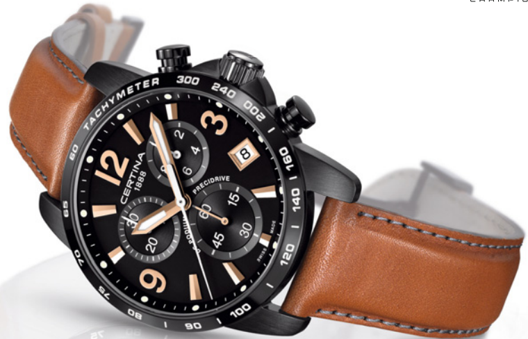
DS Podium Chronograph