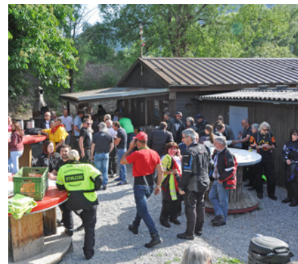
Randonnée valaisanne des motards

N'oubliez pas la concentration internationale de motos à l'occasion des 100 ans du Moto Club Vevey qui organise en même temps une superbe exposition ainsi que le Rallye FMS, venez nombreux à Vevey aux Galeries du Rivage du 23 au 25 septembre prochains. Profitez ce sera une belle fête. Possibilité encore de s'inscrire rapidement. Voir le site www.motoclubvevey.ch ◆