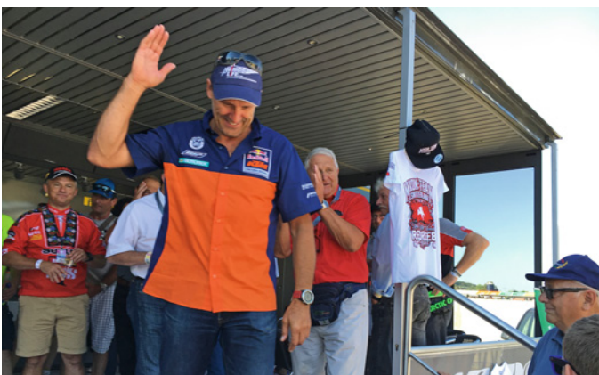
Heinz Kinigadner, Weltmeister / Champion du monde 1984-1985