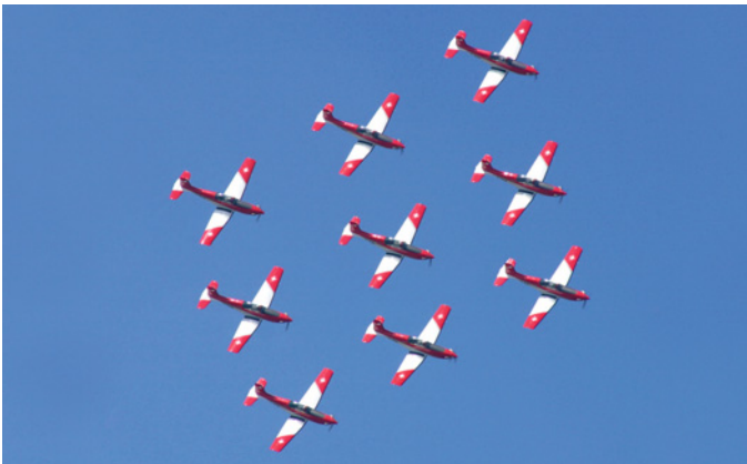
PC 7 Swiss Airforce Show.