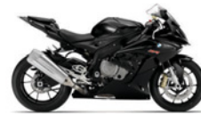
S 1000 RR ABS