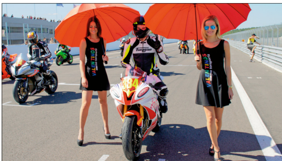
SM Strasse Route 2016