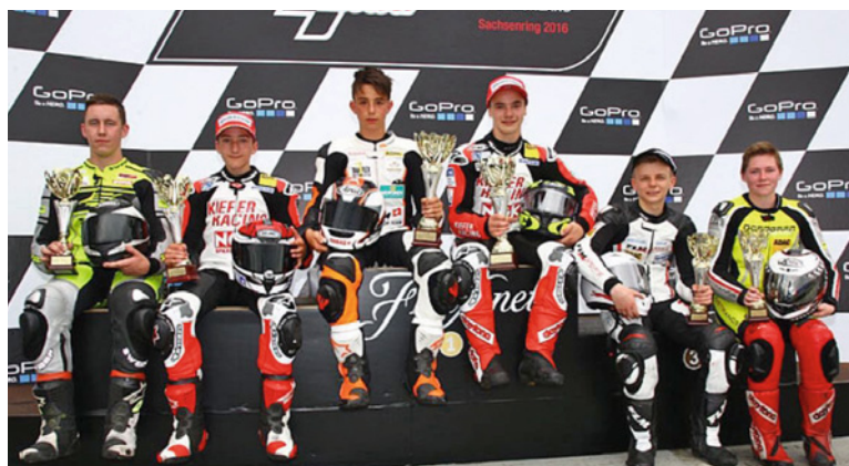
Podium Moto3 Standard und Moto3 GP