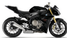
S 1000 R ABS