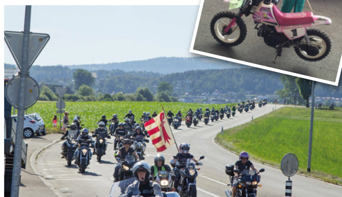
Défilé motards-100 ème