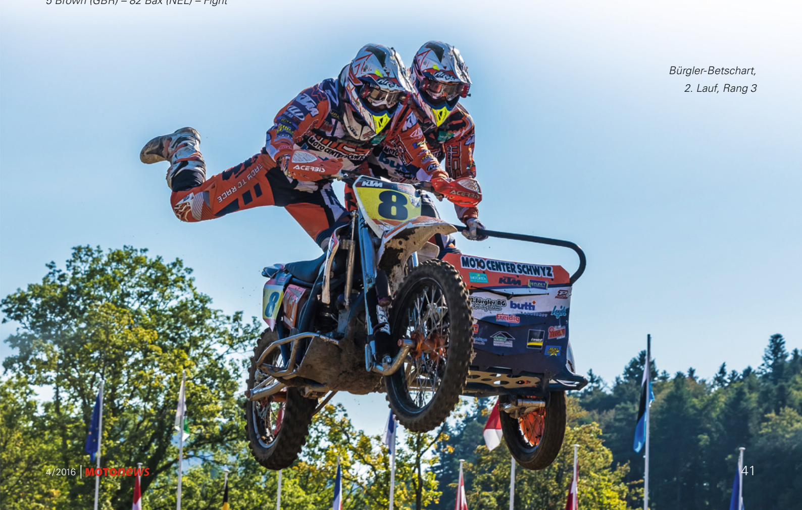
Bürgler-Betschart, 2. Lauf, Rang 3