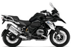
R 1200 GS ABS

On n'a pas tous les jours 100 ans. Saisis cette occasion et profite de ta visite chez ton concessionnaire BMW Motorrad pour faire une course d'essai sans engagement.