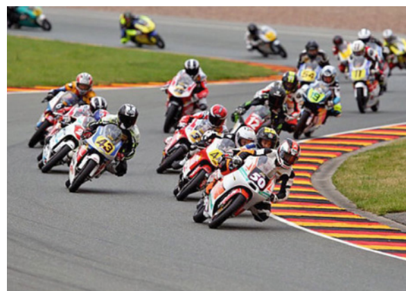
NEC Moto3 Sachsenring