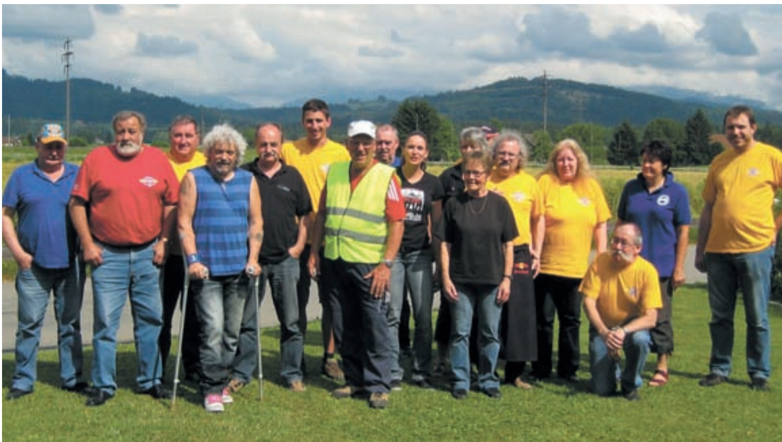
Die Organisatoren von Fun Day MC Heimberg / Les organisateurs du Fun Day MC Heimberg

Es ist immer wieder eine besondere Freude am Fun Day des MC Heimberg in Kiesen teilzunehmen. Zuerst ging es auf eine hervorragend organisierte Rallye in der näheren Umgebung und anschliessend zur Blutspende in Glaubenberg.