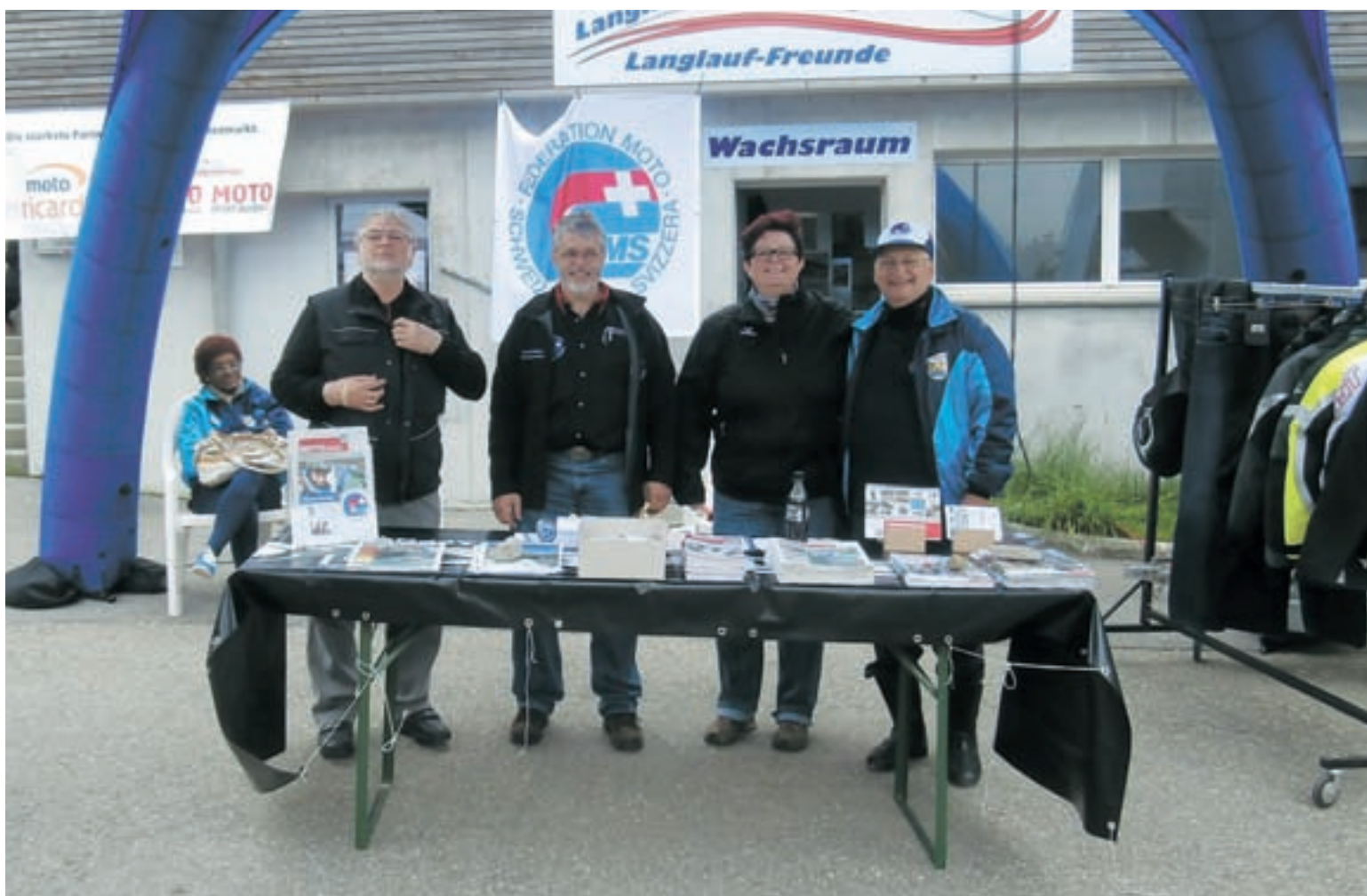
Stand FMS au Glaubenberg / FMS-Stand in Glaubenberg