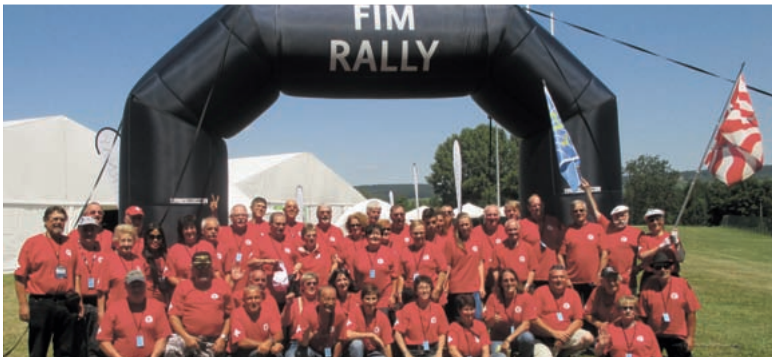
Das Schweizer Team / L'équipe de Suisse

Il y a quatorze ans, le Moto-Club Epernay invitait les motards du monde entier pour le Rallye FIM, cette année ils ont remis ça. La Suisse était bien présente avec plus de 60 participants, elle a obtenu de beaux résultats avec une belle victoire des Side-Car au Challenge Nederland, Le Moto-Club des Bayards a été auréolé de belles performances avec une victoire interclubs, une seconde place de ces dames au Challenge San-Marino avec aussi un troisième rang du club au Challenge Austria. L'équipe suisse obtient un résultat d'ensemble magnifique avec un huitième rang du Challenge FIM remporté par la Finlande.