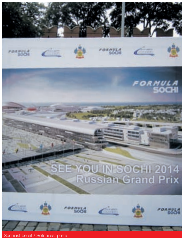
Sochi ist bereit / Sochi est prête