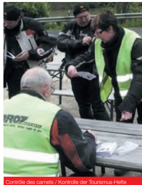
Contrôle des carnets / Kontrolle der Tourismus-Hefte