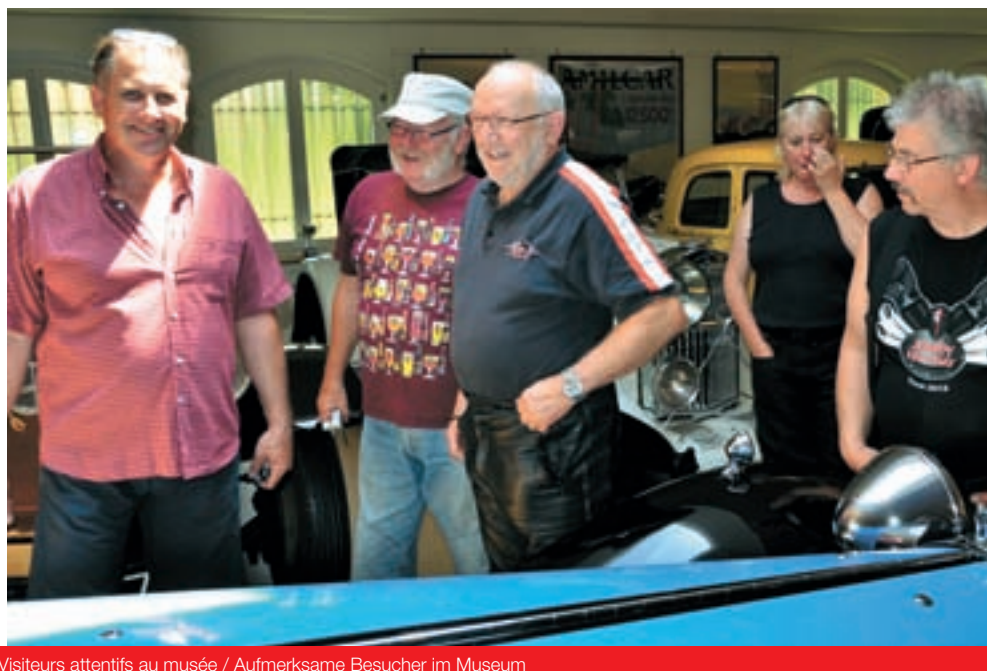
Visiteurs attentifs au musée / Aufmerksame Besucher im Museum