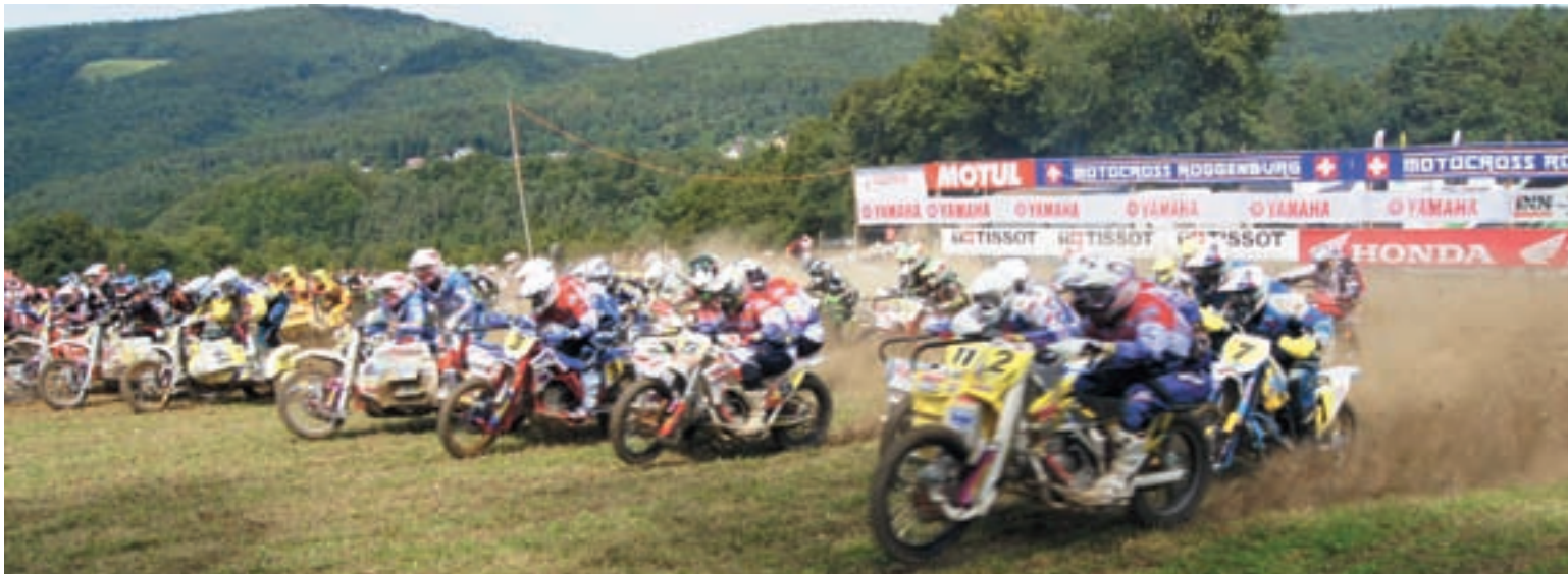
Start in Roggenburg

Par un temps ensoleillé et devant une belle coulisse de spectateurs, les organisateurs du MC Roggenburg peuvent se réjouir du succès d'une belle manche de championnat du monde de side-cars. 42 équipes de 12 nations ont présenté leurs machines aux commissaires techniques de la FIM et de la FMS.