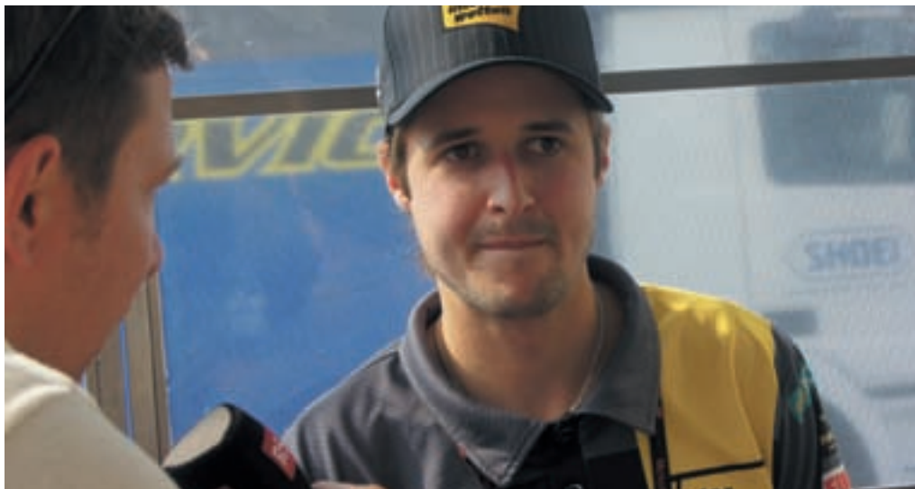
Tom Lüthi hofft auf bessere Zeiten / Tom Lüthi espère une meilleure phase