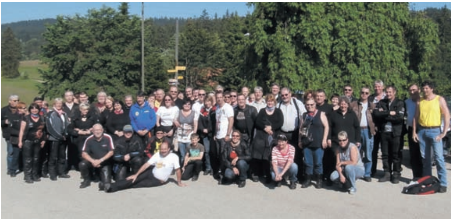
Zahlreiche Teilnehmer in Cernets / Les nombreux participants aux Cernets