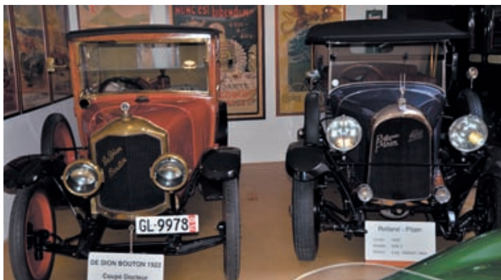
Schöne Wagen im Museum der Stiftung Renaud / de belles voitures