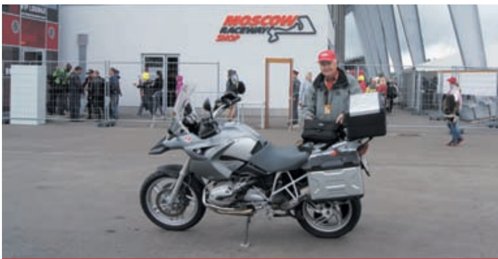
Moscow-Raceway, die perfekte Anlage / Moscow-Raceway, le circuit parfait