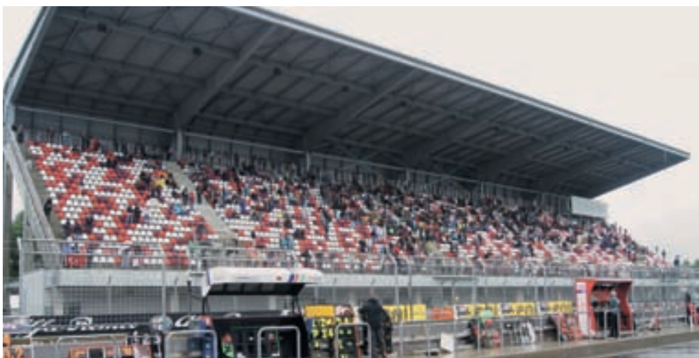
Wo bleiben die Zuschauer? / Où sont les spectateurs?