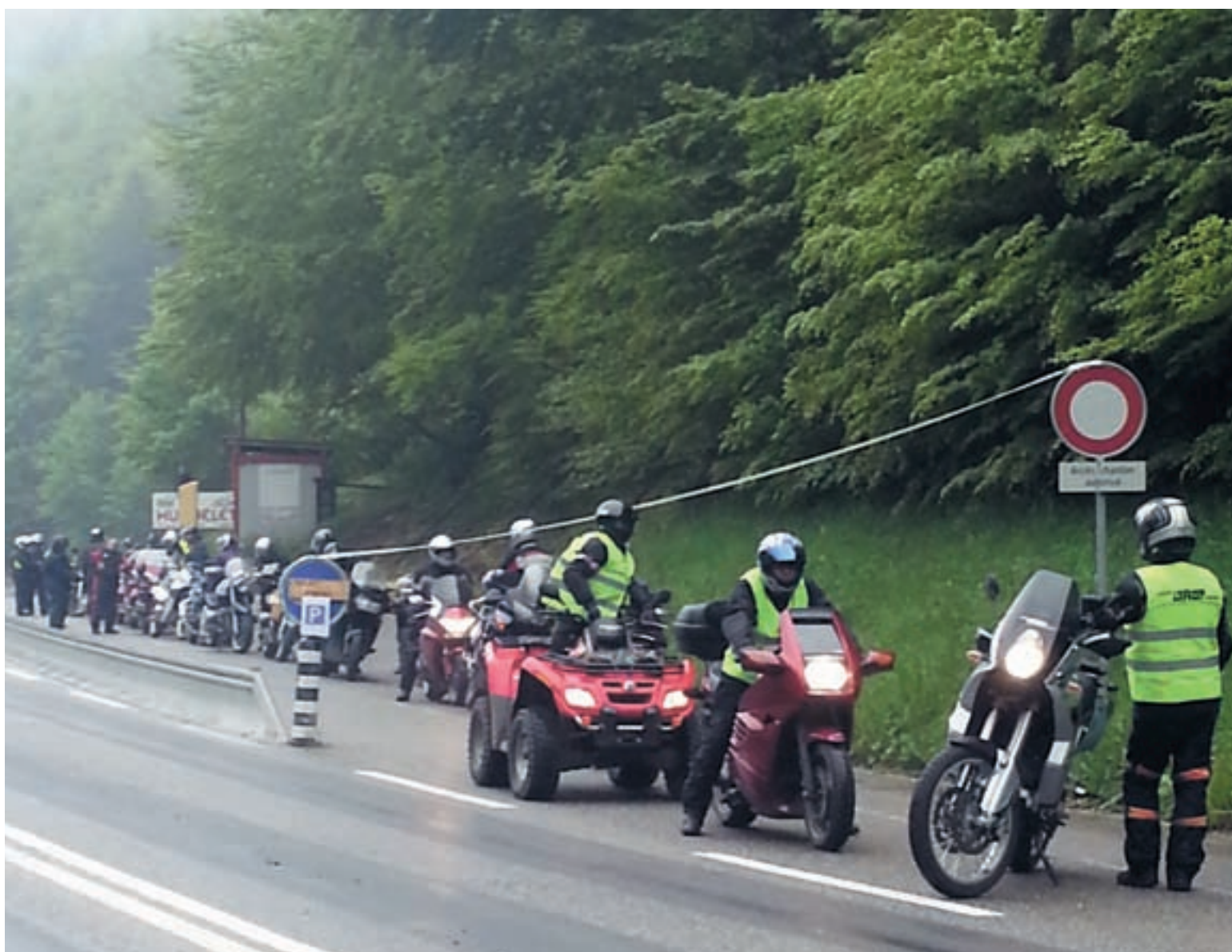
Die Töfffahrer am Start / Les motards au départ