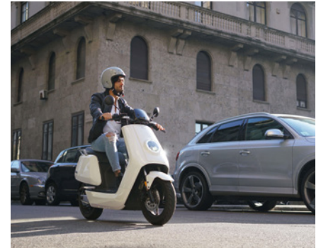
Niu N (Elektro)

► Während die etablierten Hersteller mit der Tagesaktualität schneller-stärker-schöner beschäftigt waren und die Guardia di Finanza vier Elektroroller beschlagnahmte, ist eine spannende Entwicklung im Gange. Niemand weiss, ob und wie die Motorradwelt umgekrempelt wird.