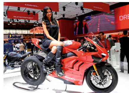
Ducati Panigale V4 R