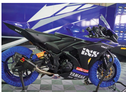
La moto R3 BLu cRU du Cup