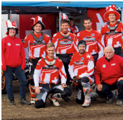
MXoN Sidcar Team CH 2018

Ainsi, la 5 ème place de départ revenait