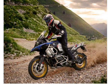
BMW R 1250 GS Adventure