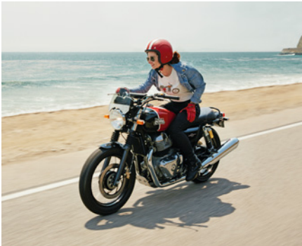
Royal Enfield Interceptor 650