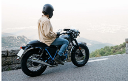
Brixton BX 125 Haycroft