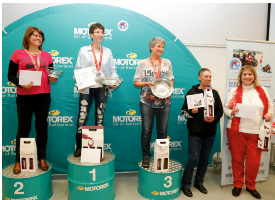
Damen / Dames