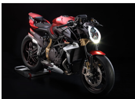
MV Agusta Brutale 1000 Serie Oro