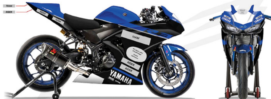
Présence possible de sponsors

Vous trouvez d'autres informations sous: www.yamaha-r3cup.ch ◆