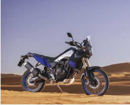
Yamaha XTZ 700 Tenere