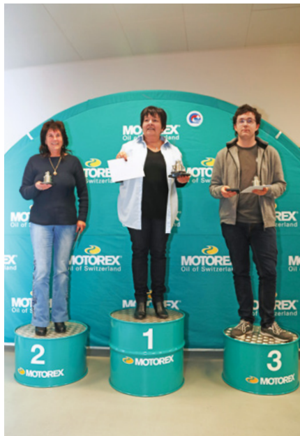
Beifahrer / Passagers