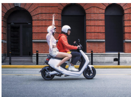
Niu Mplus (Elektro)