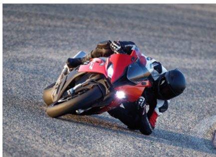
BMW S 1000 RR

Il y a même eu un scandale électrique: sous la pression de Piaggio, la police financière italienne a confisqué avant l'ouverture de l'exposition 4 véhicules d'exposition électriques du constructeur allemand Kumpen, qui s'avéraient des copies de la nouvelle Vespa Lettrica. ◆