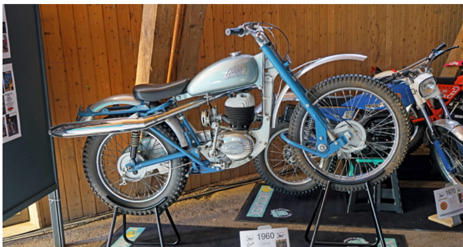
Une exposition retraçant 50 ans d'évolution des motos de trial : de la Greeves Scottish des années 60 (photo) à la Vertigo Titane à injection en passant par la moto électrique de la marque EM.

Walter Wermuth | Une édition 2018 particulière avec l'autorisation de reprendre le parcours mythique d'antan (15 km). Un trial sur 2 jours avec animations et exposition de motos de trial. ◆