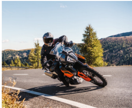
KTM 790 Adventure